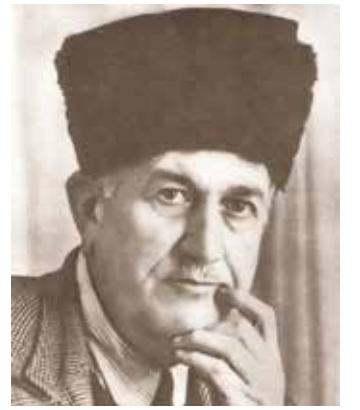
شعر/ أحمد رفيق المهدي

يا أيها الوطن المقدس عندنا شوقاً إليك، فكيف حالك بعدنا