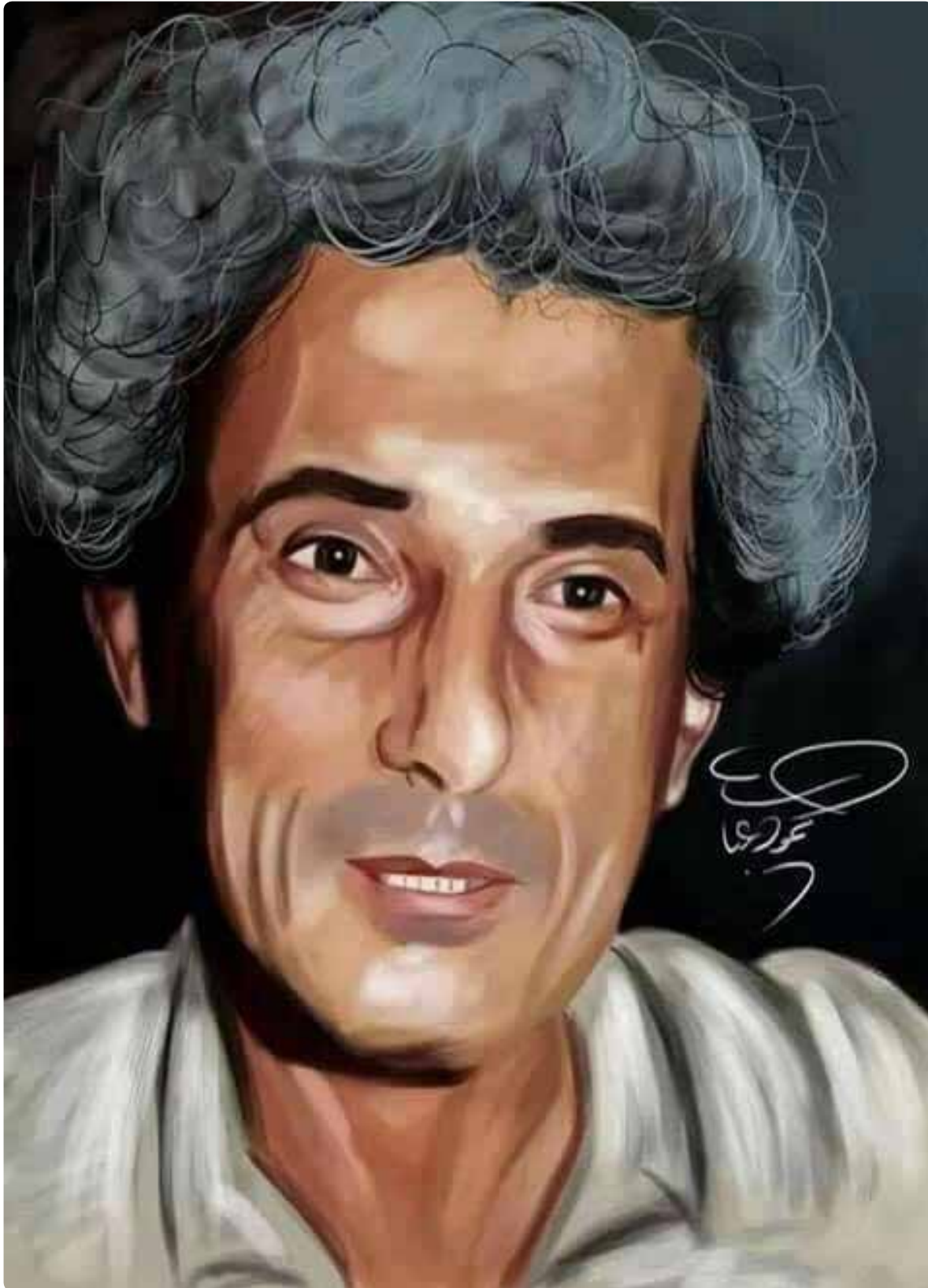
رجل ناجي العلي.. وبقي حنضلة