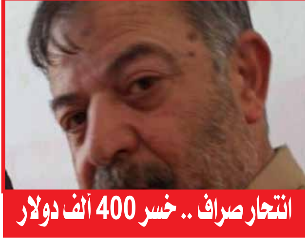
انتحار صراف .. خسر 400 ألف دولار

أقدم صراف سوري على الانتحار كمدا وحزنا بعدما خسر ما يقرب من 400 ألف دولار خلال يوم واحد، بسبب تدهور وتقلب سعر الليرة في الأونة الأخيرة.