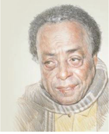
الشاعر الكبير محمد الفيتوري

أنا زنجي قلها لا تجبن قلها في وجه البشرية ان زنجي وابي زنجي الجد وامي زنجية انا اسود اسود لكني حر امتلك الحرية ارضي افريقية عاشت ارضي عاشت افريقية ارضي والابيض دنسها دنسها المحتل العادي فلامض شهيدا وليمضوا مثلي شهداء اولادي فوزاء الموت .. وراء الارض تدوي صرخة اجدادي لستم ببنيانا ان لم تذر الارض رماد الجلاد لستم ببنيانا ان لم يجلب الغاصب عنها مدحورا ان لم تخلع اكلان الظلمة ان لم تتفجر نورا ان لم يرتفع العلم الاسود فوق رباها منصورا ان لم يحن التاريخ لكم جبهته فرحان فخورا الفجر يدك جدار الظلمة فاسمع الحان النصر هاهي ذي الظلمة تداعي تساقط تهوي في زعر ها هو ذا شعبي ينهض من اغمائه عاري الصدر ها هو ذا الطوفان الاسود يعدو عبر السد الصخري ها هي ذي افريقيا الكبرى تتألق في ضوء الفجر