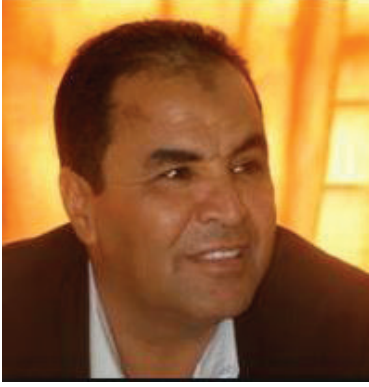
أبو القاسم المرزادوي

تذكر متعة السفر بالقطارات فأراد أن يكتب قصة يحكي فيها عن رجل كان شغوفا بهذه الهواية حد الهوس ، ولأنه من بلد لا يعرف سكانه عن القطارات إلا ما كان يأتيهم من بلدان شرق آسيا من ألعاب تمثل قطارات عديدة تسير على سكك حديدية حلزونية مختلفة الأنواع والأشكال كل يسير بالسرعة والقدر الذي يتوفر في البطاريات المختلفة الأحجام التي تأتي في غالب الأوقات إما مملوءة أو نصف عمر أو فارغة تماماً في كثير من الأحيان ومن نفس البلدان التي تتنافس على صناعة مثل هذه الألعاب التي لا تعمر طويلاً بغض النظر عن حرص أو شقاوة الأطفال المقتنين لمثل هذه الألعاب كباراً كانوا أو صغاراً..