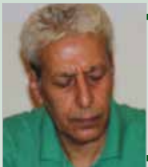
بقلم ... سعيد هادف

السياسية المغربية ونخبها الأكاديمية. ويبدو أن تصريحات الريسوني، التي لا شك أنها جاءت بإيعاز من جهة ما (ليست مغربية بالضرورة)، كانت بمثابة قبلة سقطت في بيت الاتحاد العالمي لعلماء المسلمين، وأن مصير الاتحاد بشكل خاص والإخوان بشكل عام، مرهون بحجم انفجار هذه القبلة، وبالتالي فإن تصريحات الريسوني لا تستهدف المنطقة المغربية إلا في إطار علاقة هذه المنطقة بمصير التنظيم العالمي للإخوان المسلمين.