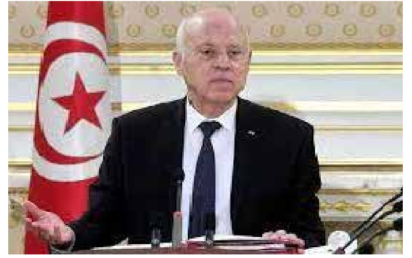
الداخية التونسية تكشف عن وجود مخطط جدي لاستهداف قيس سعيد

أكد أحد أعضاء اللجنة الاستشارية لصياغة دستور «الجمهورية الجديدة» أن صلاحيات البرلمان في مشروع الدستور الجديد الذي تم عرضه على رئيس الدولة أمس الإثنين ستكون التشريع والمراقبة والمسائلة، وأوضح المصدر، في تصريح ل «بوابة إفريقيا