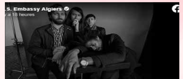
من كنت تعلم أنه توجد فرقة روك أمريكية اسمها «الجزائر» نسبة إلى الجزائر العاصمة؟ وقد نشأ أعضاء الفرقة الأربعة وهم يعزفون الموسيقى معاً في مدينة أتلانتا الجنوبية، بولاية جورجيا. وعندما أنشأوا فرقتهم في 2012، استوحوا اسمها «الجزائر» من فيلم معركة الجزائر. تعتمد موسيقى الفرقة على مزيج من المؤثرات، وتحمل رسائل ثورية قوية وأفكار مناهضة للعنصرية. ومن أشهر أغانيهم: «صرخة الشهداء» و«الجانب الخفي للسلطة» و«أول نوفمبر 1954» (منقولة من صفحة السفارة الأمريكية بالجزائر).

هل كنت تعلم أنه توجد فرقة روك أمريكية اسمها «الجزائر» (Algiers) نسبة إلى الجزائر العاصمة؟ وقد نشأ أعضاء الفرقة الأربعة وهم يعزفون الموسيقى معاً في مدينة أتلانتا الجنوبية (the southern city of Atlanta) بولاية جورجيا. وعندما أنشأوا فرقتهم في 2012، استوحوا اسمها «الجزائر» من فيلم معركة الجزائر. تعتمد موسيقى الفرقة