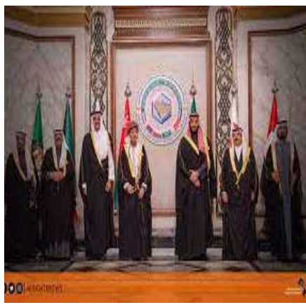
بلدان الخليج العربي تؤكد دعمها للمغرب

محادثات استراتيجية بين الرئيسين التونسي والجزائري