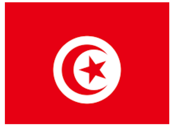
الرئيس التونسي يعلن عن جملة من الإجراءات الجديدة