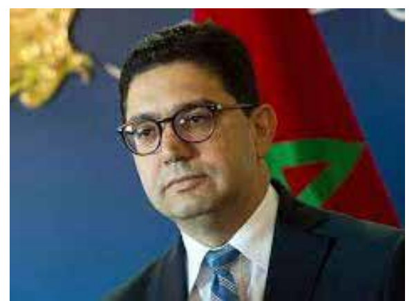
المغرب وأوروبا: استراتيجية التنوع