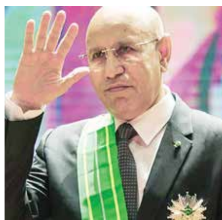
فرنسا والأرشيف الخاص بحرب الجزائر