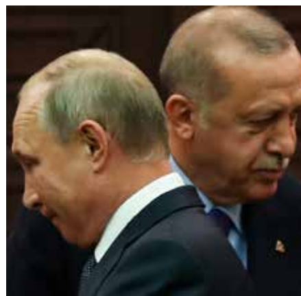
زيارة محمود عباس إلى الجزائر: السياق والخلفيات