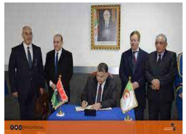
الجزائر- ليبيا: الحدود وتكوين الشرطة والحماية المدنية