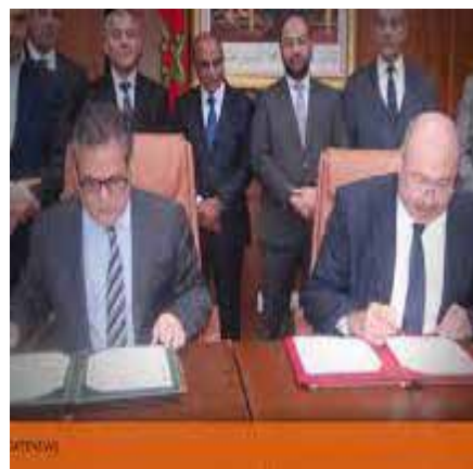
موريتانيا.. الجيش ينصب إدارات لمراقبة الحدود الشمالية