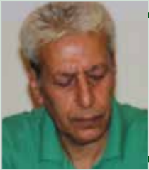
بقلم ... سعيد هادف

منذ نشأتها بعد الحرب العالمية الثانية، أصبحت منظمة الأمم المتحدة بهيئاتها الفرعية، ورشة للتفكير وصياغة المشاريع والمقترحات في بعدها الكوني الإنساني، وعلى مدى قرن إلا ربع، وضعت عدة مشاريع وبرامج في قضايا التنمية والسلام والبيئة والعيش المشترك والهجرة والأمن....، وهي قضايا تهتم كل المجتمعات والأمم، تقف بعض مقاصدها على الطريف النقيض من مقاصد قومية شوفينية في عدد من دول العالم. وقد أقرت الأمم المتحدة عشرات من الأيام العالمية لم تندمج بعد في ثقافة عدد من المجتمعات بسبب تجاهل سياسات عدد من الدول لقيمة هذه الأيام وعدم إدراجها في مقرراتها التربوية وسياساتها الإعلامية، وهو أمر يعيق سيرورة التطور في تلك الدول المغلقة في وجه العالم والمتوقعة حول ذاكرتها.