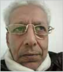
بقلم .... سعيد هادف

لا يتسع المقام للحديث بإسهاب عن مفهوم «الحراك» ودلالاته اللسانية، الفلسفية والسياسية والسياسية والسياسية، وعلاقته بالثورة، كما أن العنوان يحتاج إلى كتاب أو إلى دراسة على الأقل. لكن مرماي هنا أن ألفت انتباه القارئ إلى نقاط أساسية، يمكنه الانطلاق منها للتعمق أكثر في الأبحاث المختصة.