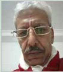
بقلم ..... سعيد هادف