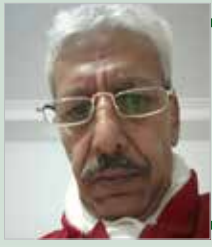
بقلم .... سعید هادف

انطلاقاً من القاعدة المنطقية التي تقول أن «الحكم على الشيء جزء من تصوره»، نفهم أن معالجة مشكلة من المشاكل هو جزء من تشخيصها، وكل تشخيص خطأ يؤدي إلى علاج خطأ، وبالتالي فإن معالجة وضع سياسي مختل يقتضي بالضرورة تشخيصاً سليماً. في العالم الناطق باللسان العربي ولا سيما المنطقة المغاربية نلاحظ أن الحلول غالباً ما تساهم في تعقيد الوضع.