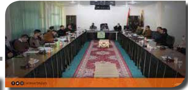
صناعة القرار السياسي المغاربي وراهنية المشاركة السياسية