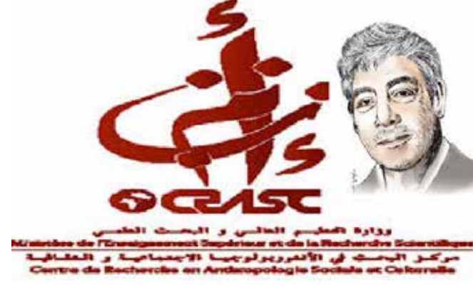
وزارة التعليم العالي والبحث العلمي Ministère de l'Enseignement Supérieur et de la Recherche Scientifique مركز البحث في الأنثروبولوجيا الاجتماعية والثقافية Centre de Recherche en Anthropologie Sociale et Culturelle