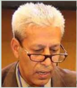
بقلم .... سعید هادف

من ليبيا يأتي الجديد. هذه المقولة ينسبها البعض إلى المؤرخ الإغريقي هيرودوت، وهناك من ينسبها إلى الفيلسوف أرسطو؛ ومع أن الفارق الزمني بين ليبيا هيرودوت وليبيا اليوم يقارب 25 قرناً فإن ليبيا، أعني هذا الاسم الطوبوغرافي بقي صامداً رغم كل تلك الأحوال والدهور التي مر بها شمال أفريقيا، في الوقت الذي زالت أسماء جغرافية ونبتت مكانها أخرى. كنت دائماً أتساءل إن كان هناك منطق صلب وراء بروز بلدان شاسعة كالجزائر وليبيا وأخرى صغيرة كتونس أم أن المسألة مجرد لعبة رند؟